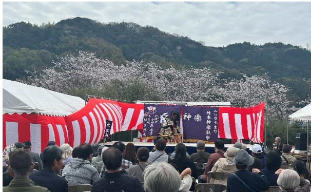
柳井桜土手さくらまつり