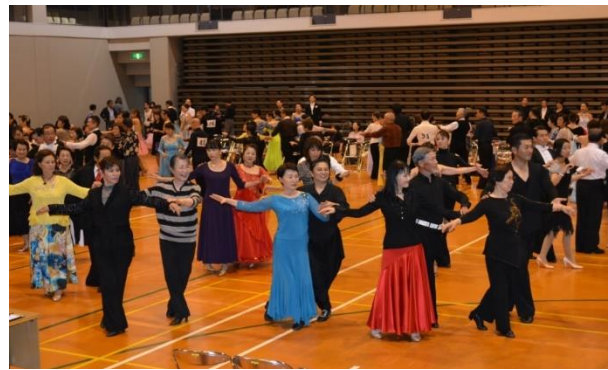
ダンスタイム風景