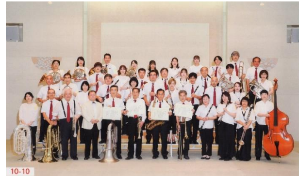
全日本吹奏楽コンクール山口県大会