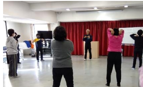
フレイル予防講座