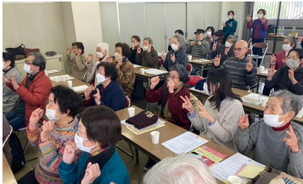
認知症予防講演会