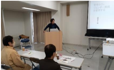
ジェンダー平等に関する講座