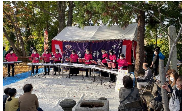
大歳神社跡地の披露目会