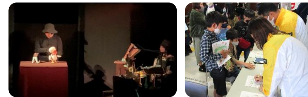
明治安田生命の皆さんによる野菜摂取充足度「ベジチェック」の無料測定も行われました

ガイドラインに沿って体調確認や手指消毒、人数制限、換気などの対策が取られた会場で、子どもたちは、美しくも不思議な人形劇の世界に引き込まれていました。