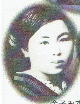
金子みすゞ 生誕の地