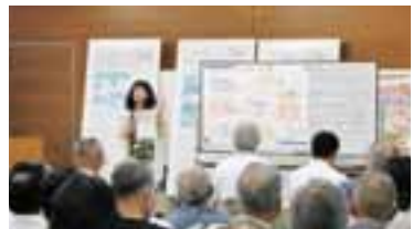
実務的・専門的なアドバイスで、地域の課題解決や活性化、男女共同参画社会の実現を支援します。

お申込み・お問い合わせ 公益財団法人 山口きらめき財団 TEL.083-929-3600 ※詳しくは、財団ホームページをご覧ください。