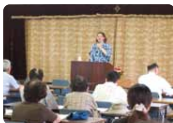
異文化の理解や 女性の社会進出の重要性を説明