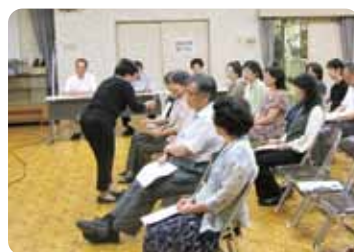
DV防止のための人権意識の醸成、 被害者への接し方を学習