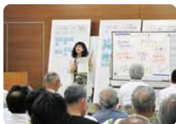
地域づくりに住民がどう関わるか アドバイス